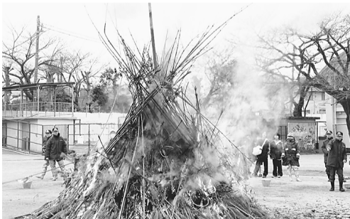
▲恒例の「どんど焼き」

防犯の面では、普段の広報活動に加えて、隣接町会の犬の飼い主も含めて日常的にわんわんパトロールが行われ、特に年末夜間には、防火と併せて防犯パトロールを実施しています。また、ふれあいと絆作りを目指して、杉並第八小学校での高円寺南地域の「ふるさと祭り」「わが街ふるさと運動会」「どんど焼き」杉八小子どもキャンプ村」に協力参加しています。