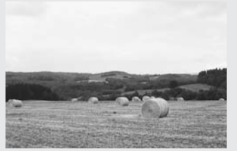
▲広大な名寄市の大地

北海道名寄市では地元地域住民と一緒に、地域活性化に貢献していただける人材を募集しています。詳細は、お問い合わせください。