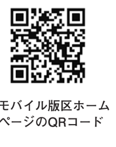
▲モバイル版区ホームページのQRコード

◇モバイル版区ホームページ http://www.city.suginami.tokyo.jp/mobile/ ◇上高井戸区民集会所 自動交付機の利用中止 上高井戸区民集会所は投票所になります。このため、6月23日(日)の投票日は同集会所内に設置してある証明書自動交付機が1日利用できません。