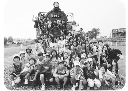
◀ 昨年の名寄編 （名寄公園にて）