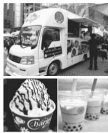
▲おいしい物がたくさんあります!