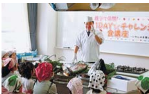
▲皆で楽しく学びます