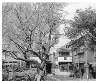
▲町会のシンボル、桜並木

さくら町会の町並みは、まさに歴史そのものです。約12戸の家が1列に並び南北方向の家々は18列に計画的に配置され、そして桜並木から枝分かれをした路地は2列毎に通じています。この2列の住宅群は台所側を向かい合わせにして並んでいます