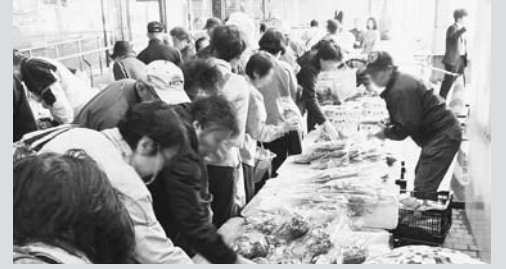
▲大好評の吾妻の朝市！ 毎日にぎわっています

【日時】 5月23日(休)午前10時～午後1時 【場所】 区役所中杉通り側入口前 【内容】 野菜（ほうれん草、小松菜、レタス、ネギなど）、農産品ほか（米、味噌、梅干し、蜂蜜、りんごジュースなど） 【申し込み】 当日、直接会場へ 【問い合わせ】 文化・交流課交流推進担当 【その他】 混雑緩和のため、人数制限あり