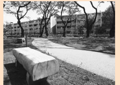
▲大谷戸さくら緑地