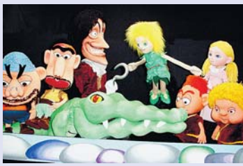
▲人形劇「ピーターパン」

人形劇「ピーターパン」 忘れていった自分の影をとりもどしにやってきたピーターパンは…。 ①1日(土)午前11時～11時50分②午後1時30分～2時20分 定員各回200名(先着順) 費無料