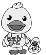
▲ふろっとくん(杉並区浴場組合公認キャラクター)

時12月22日(月) 場区内各公衆浴場(営業時間は、最寄りの銭湯へお問い合わせください) 費460円(小学生以下無料) 申込当日、直接各公衆浴場へ 場各公衆浴場(午後1時以降) 他 大人はくじ引きあり。景品が当たります