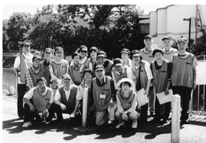
▲防災訓練の仲間たち

もしもの災害に備え防災訓練をはじめ、防災懇談会、防犯懇談会なども定期的に開催しています。最近では杉並消防署の指導のもとスタンドパイプの訓練を隣接の松溪自治会と合同で実施しました。また、毎年恒例のラジオ体操会、歳末夜警は多くの方に参加をしていただいています。その他、公園の清掃など皆さんの協力があり終了後のさわやかさを実感しています。