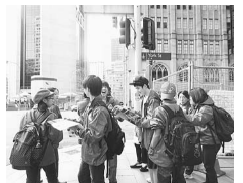
▲シドニー市内を班別行動

ホームステイでは、本当に温かい家庭に迎え入れていただき、とても幸せな時を過ごせた。会話を聞き取ることはできたものの、自分の意見を直球で伝えるにはまだまだ勉強が足りないのだと実感した。また、外国人の考え方や、食文化、休日の過ごし方、日常生活を体験でき、少し世界観が広がった気がした。