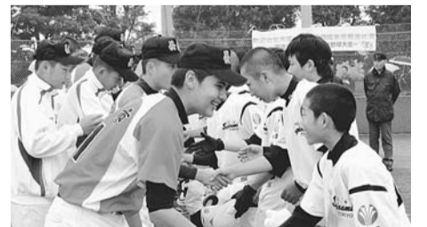
▲中学校親善野球大会

今回の交流大会で僕は、他の自治体の人たちと交流し、スポーツは人と人をつなぐ素晴らしいものだということや、チームワークの大切さを学びました。今後、この大会で学んだことを活かし、自分やチームの成長に役立てていきたいと思っています。