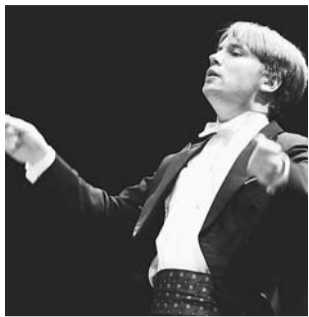
▲ピエタリ・インキネン

時11月21日(金)午後1時 杉並公会堂(上荻1-23-15) 出演=ピエタリ・インキネン(日本フィル首席客演指揮者)、日本フィルハーモニー交響楽団(管弦楽)▷曲目=ラヴェル「ダフニスとクロエ」第2組曲(予定) 小学生以上の方定600名(先着順) 無料申込当日、直接会場へ文化・交流課開演後は入場できません