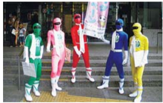
▲杉並戦隊イレンジャーが登場!

●なみすけスタンプラリー=スタンプを集めた方には、なみすけグッズを差し上げます(数に限りがあります)。