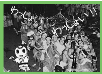
ウェブサイトもあるよ！

法被姿の氏子衆が神輿を担いだり山車を引いたりする姿は、昔からなじみがありますが、最近では子供たちがお囃子を奉納するなど、身近な行事の1つとして親しまれています。