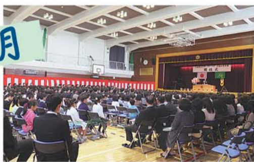
杉並和泉学園開校。9年間を見通した一貫性のある教育を実践します