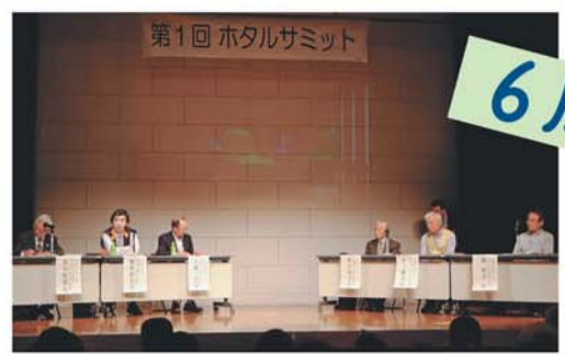
「ホテルサミット」開催。交流自治体とのパネルディスカッションなどが行われました