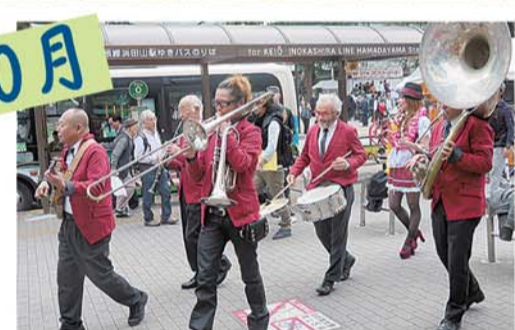
阿佐谷ジャズストリート開催。今年も街中にジャズがあふれ返りました