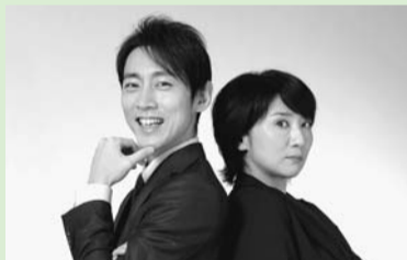
▲小泉孝太郎・松下由樹