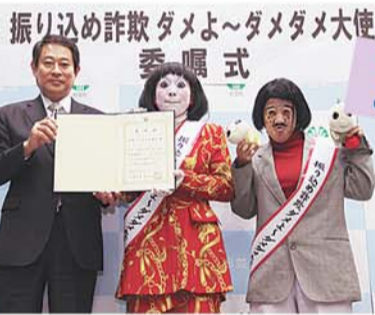
振り込め詐欺根絶集会の開催。区は詐欺被害防止に全力で取り組んでいます