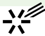
杉並区文化芸術活動助成事業

区における文化芸術の一層の振興を図ることを目的に事業に係る経費の一部を助成します。