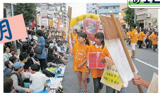
夏の風物詩、東京高円寺阿波おどり会場では杉並第八小学校の児童が清掃活動をしました