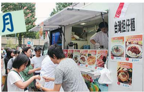
区と交流を深める台湾の魅力がぎゅっと詰まった「まるごと台湾フェア」開催