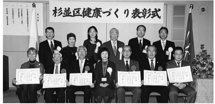
12月11日(金)に、杉並保健所長から受賞団体の皆さんへ賞状が贈られました。

区では、健康づくりへの関心や理解の増進を図るため、地域の健康づくりに先進的に取り組み、健康づくりについて地域貢献活動を行っている団体・事業所に対し、「杉並区健康づくり表彰」制度を実施しています。 このたび、27年度の受賞団体が決定しましたのでお知らせします。 ——問い合わせは、杉並保健所健康推進課 ☎3391-1355へ。