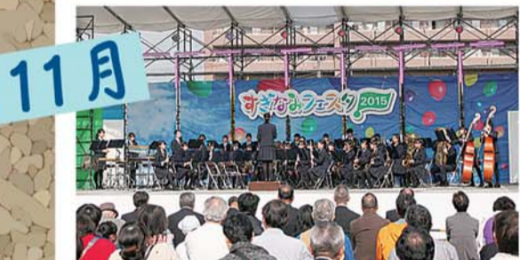
区内最大のイベント、すぎなみフェスタが開催され、2日間で約7万9000人の方が訪れました