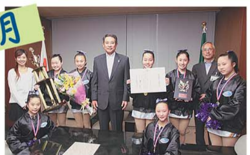
すぎなみ舞祭で活躍するチアダンスチーム「Tiggers Brave」が全米選手権で1位に！