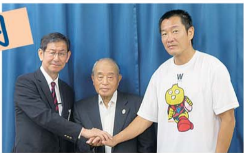
早稲田大学ラグビー蹴球部と上井草の6町会が「災害時相互援助協定」を締結