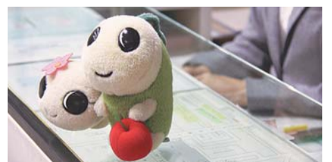
皆さん、よいお年を（なみすけ・ナミー）