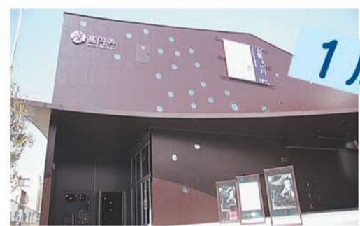
杉並区立杉並芸術会館（座・高円寺）が地域創造大賞（総務大臣賞）を受賞しました