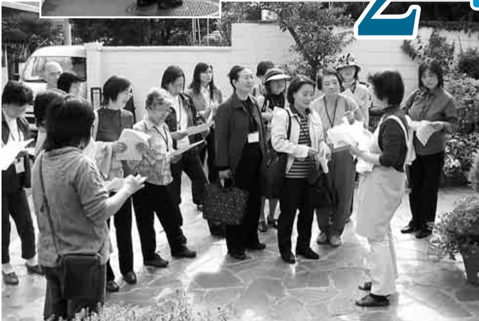
▲教室だけではなく、子育て事業の現場にも学びに行きます(地域で子育て支援講座)

すぎなみ地域大学は、地域活動に必要な知識や技術を学び、区民自らが地域社会に貢献する人材として活動し、また仲間を広げ、協働の担い手として活躍していただくための仕組みです。2年目となる19年度は、より多くの区民の方の地域活動ニーズに積極的にこたえるため、講座のテーマと内容を拡充し、多くの皆さんの参加をお待ちしています。