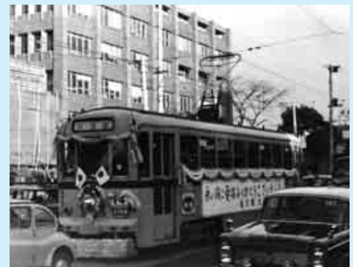
◀都電杉並線廃止記念電車(昭和38年)