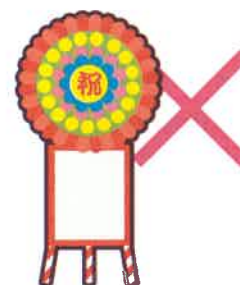
落成式・開店祝いの花輪