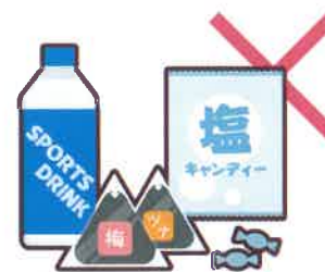
運動会やスポーツ大会への飲食物の差し入れ