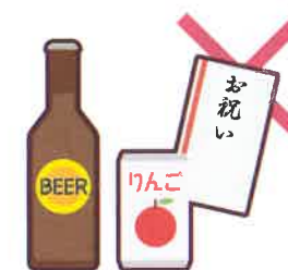
町会の集会や旅行等の催し物への寄附や飲食物の差し入れ