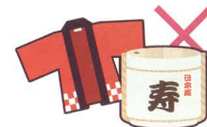
お祭りへの寄附や差し入れ

https://www.senkyo.metro.tokyo.lg.jp/ 東京都選挙管理委員会 検索