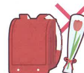
入学祝い・卒業祝い