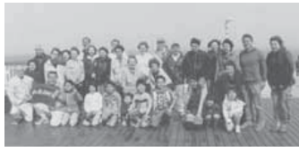
▲春の潮干狩り(東京湾アクアラインにて)

都会に住んでいる人は、生活している地域にあまり関心がない方が多いようです。極端な場合、マンションの隣人と挨拶したこともない人もいます。まして、町会という組織の存在を知らない人も少なくありません。杉並区に限らず、都市部の町会は、どこも同じような悩みをかかえているのではないのでしょうか。