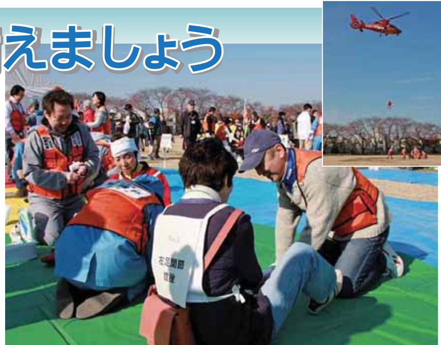
区では、区内の66カ所区立小中学校(震災救援所)で、年1回おおむね9月~11月の間に震災救援所訓練を行っています。お近くの区立小中学校での訓練に参加し、日頃から災害対策について意識を持つようにしましょう。今年度は、11月28日(日)、旧NHK富士見ヶ丘運動場で関係機関と合同で大規模な総合震災訓練を実施しました。消防・警察・陸上自衛隊のヘリコプター3機が出動した救助訓練のほか、ガス・水道・電気・電話などのライフライン機関による復旧訓練、医師会等四師会による医療救護訓練、獣医師会による負傷動物救護訓練などさまざまな訓練を行いました。今後も会場を変えながら毎年行う予定ですので、ぜひご参加ください。

災害時には情報をなかなか得られなくなります。うわさなどの不確かな情報や、誤った判断により行動をしてしまうことは、たいへん危険です。乾電池式の携帯ラジオやテレビ、携帯電話などで正確な情報を収集しましょう。