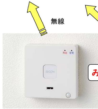
【セット解除ボックス】 120(H) × 120(W) × 33(D)