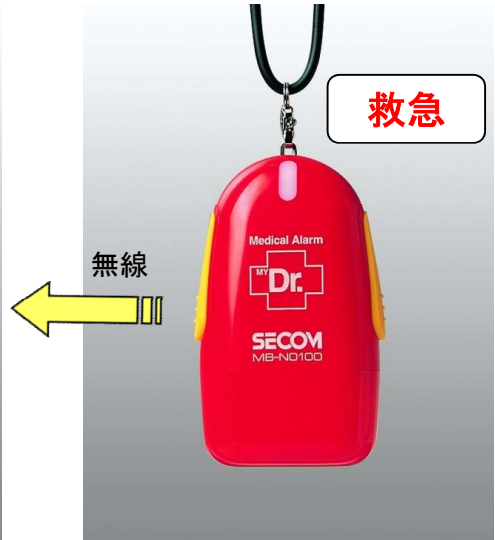
救急 【マイドクター】 69(H) × 40(W) × 23(D)