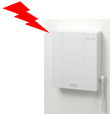
電源必要 AC100V 【無線通信アダプタ】 180(H) × 132(W) × 45(D)