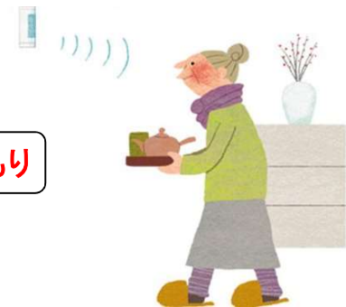
【あんしんセンサー】 135(H) × 40(W) × 48(D)