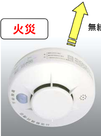
【火災センサー(煙)】 2個(台所・寝室) 105(Φ) × 47.5(H)