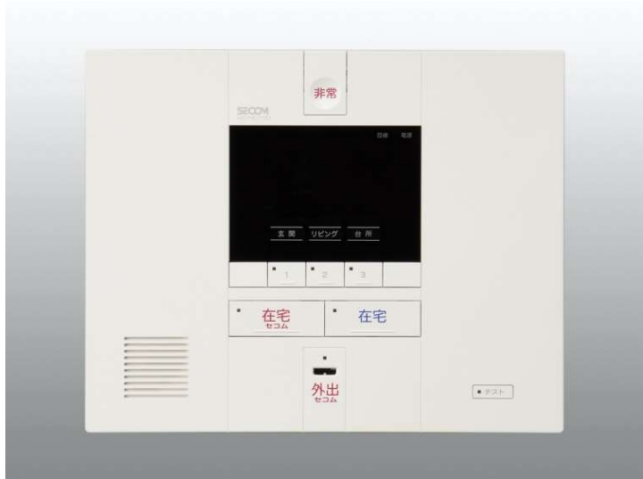
電源必要 AC100V 【コントローラー】 240(H) × 300(W) × 50(D)